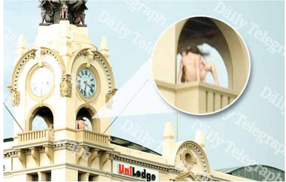
Μια σκηνή από το ερωτικό θέαμα για περαστικούς στο Μπρόντγουέι.

«Με άφησαν άναυδο με τα καμώματά τους μέρα μεσημέρι και μπροστά σε τόσο κόσμο», είπε ο τουρίστας.